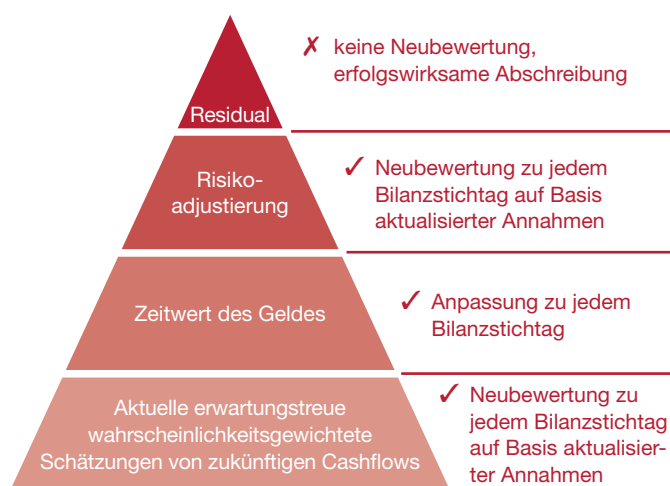
Abb. 3: Bausteine und Folgebewertung

Das vorgeschlagene Bewertungsmodell basiert auf aktuellen Informationen. Die geschätzten Cashflows sind aufgrund der vorhandenen Informationen zu aktualisieren, aktuelle Zinssätze sind für die Diskontierung zu verwenden, und die Risikomarge ist zu aktualisieren. Das Residual darf wie bereits erwähnt nicht aktualisiert werden. Die Veränderung der Verpflichtung ist in der Erfolgsrechnung zu buchen.